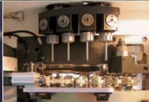
Kalıp alanı Tool room