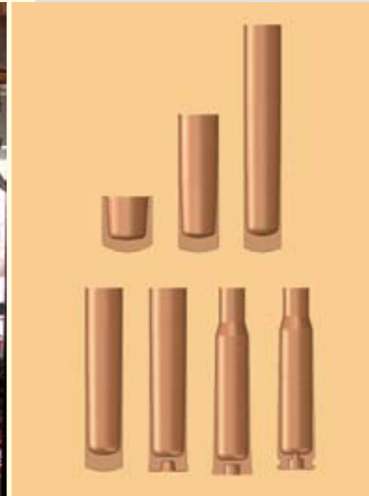
Üretim aşamaları Manufacturing stages