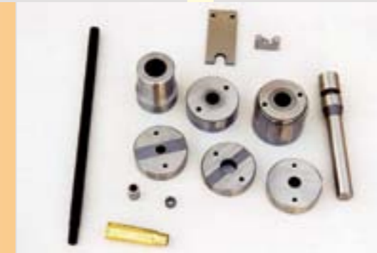
< Kalıp seti < Set of tools