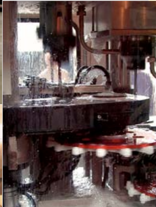
Çekme işlemi Draw process