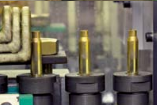
Tavlama işlemi Annealing process